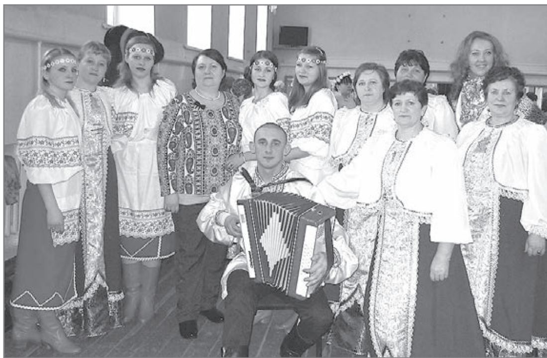
Детский и взрослый фольклорные коллективы Старогорносталевского СДК.